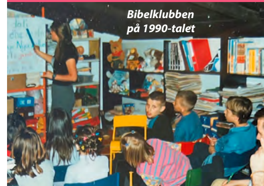
Bibelklubben på 1990-talet

Besa gick i pension för några år sedan och den yngre generationen fortsätter arbetet.