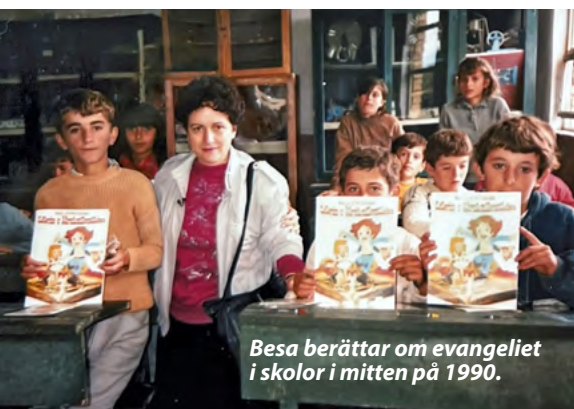
Besa berättar om evangeliet i skolor i mitten på 1990.

Tolken kom till tro och började leda arbetet i den nyinrättade Mission Possible Albanien!