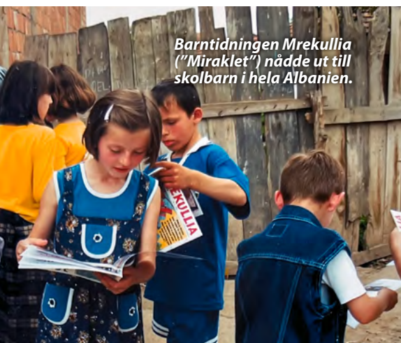
Barntidningen Mrekullia ("Miraklet") nådde ut till skolbarn i hela Albanien.