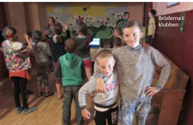
Bröderna i klubben